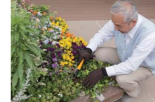
趣味を活かしたガーデニング