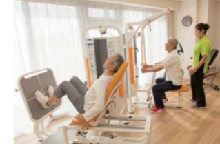
マシンを使った筋力トレーニング