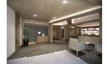
玄関奥に広がるカフェラウンジ