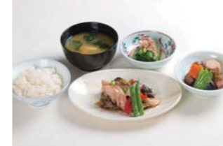
食材にこだわったバランスの良い食事

最近では、各ホームが独自のサービスを行う事も珍しくなくなってきました。産地直送などの食材にこだわった特別食を提供するホームや、リハビリ室などを設けて健康促進に力を入れるホーム、庭や屋上で植物の栽培をするホームなど、施設での生活もたいへん豊かになってきています。私がホーム長を務める